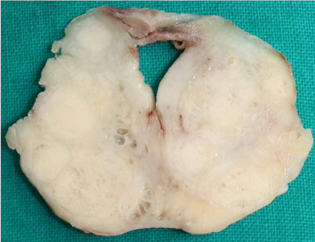
Fig 2 – Superfície de secção