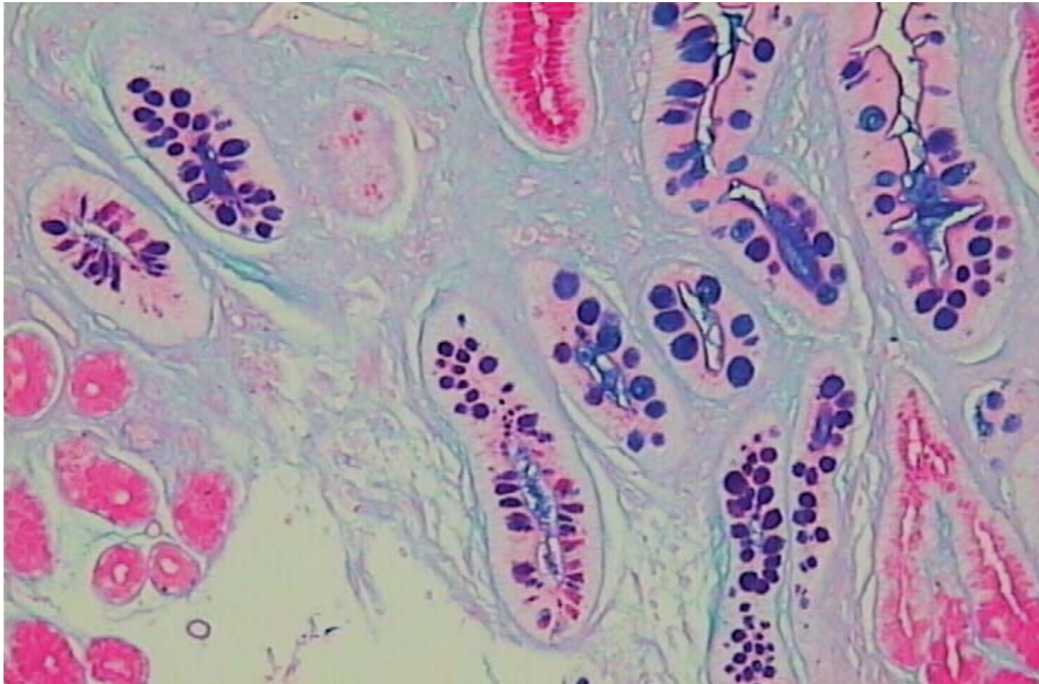
Fig. 3 – PAS-AB