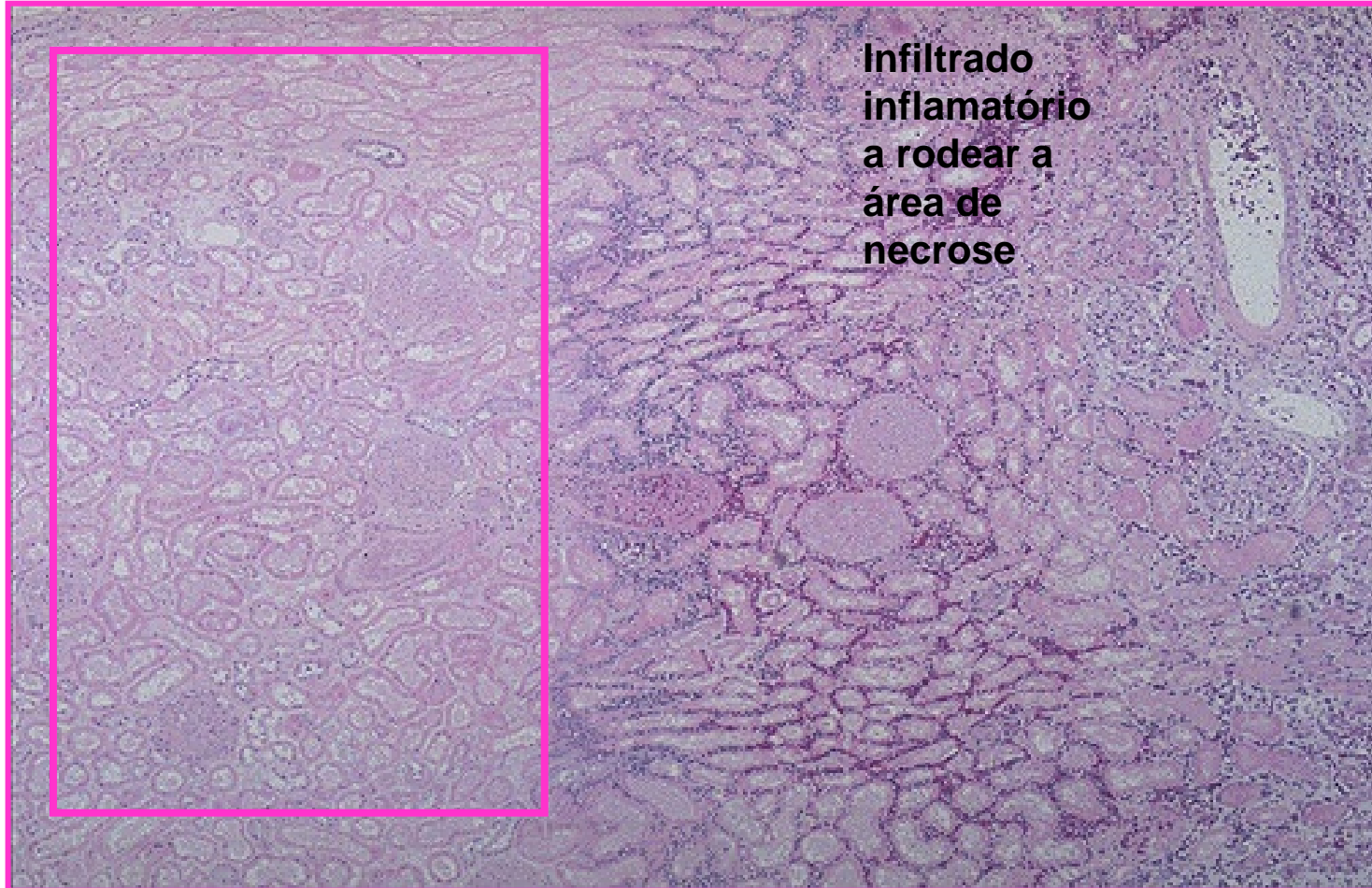
Fig. 2: Rim. H&E (10x)