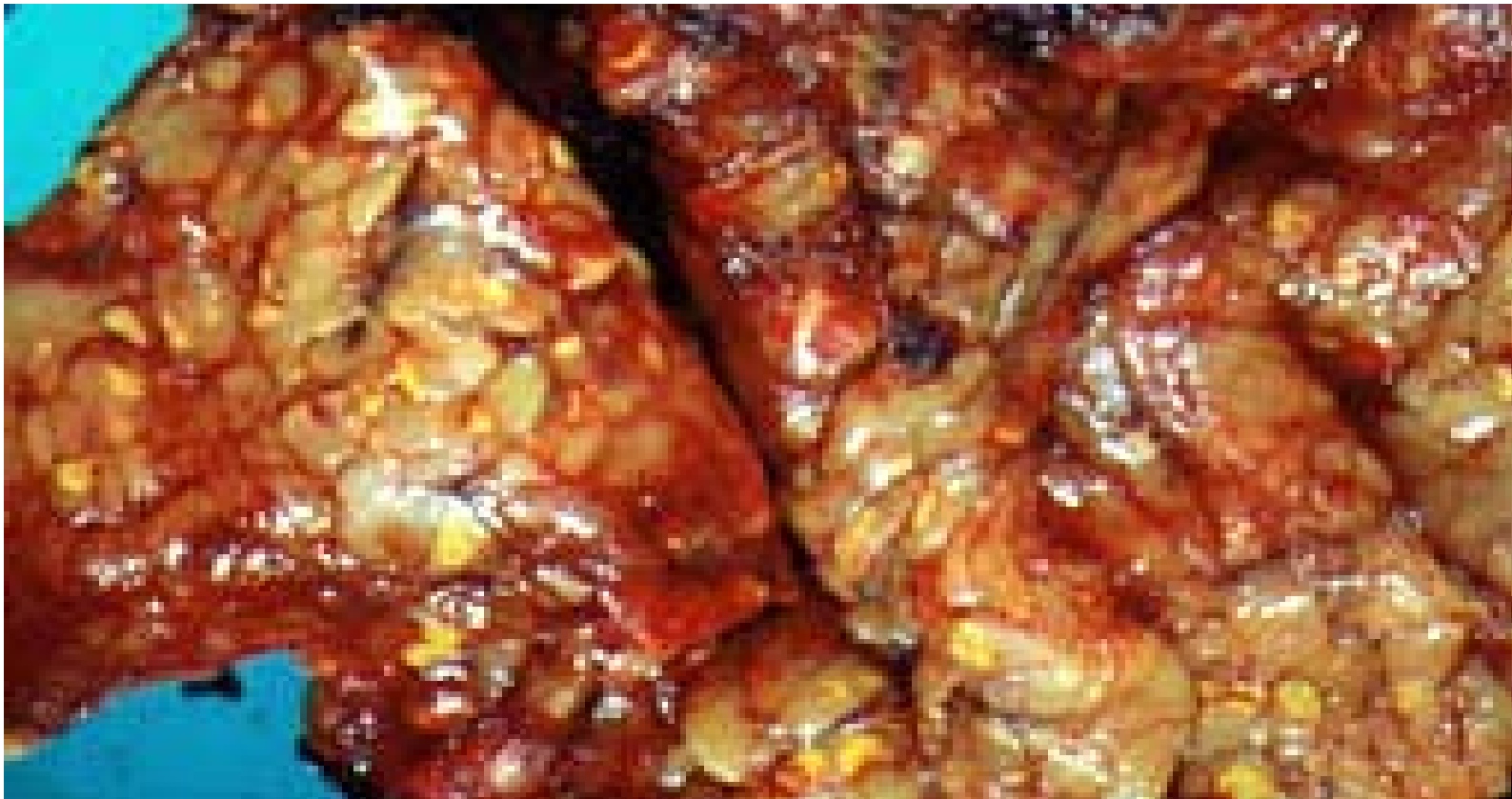
Fig. 1: Pâncreas